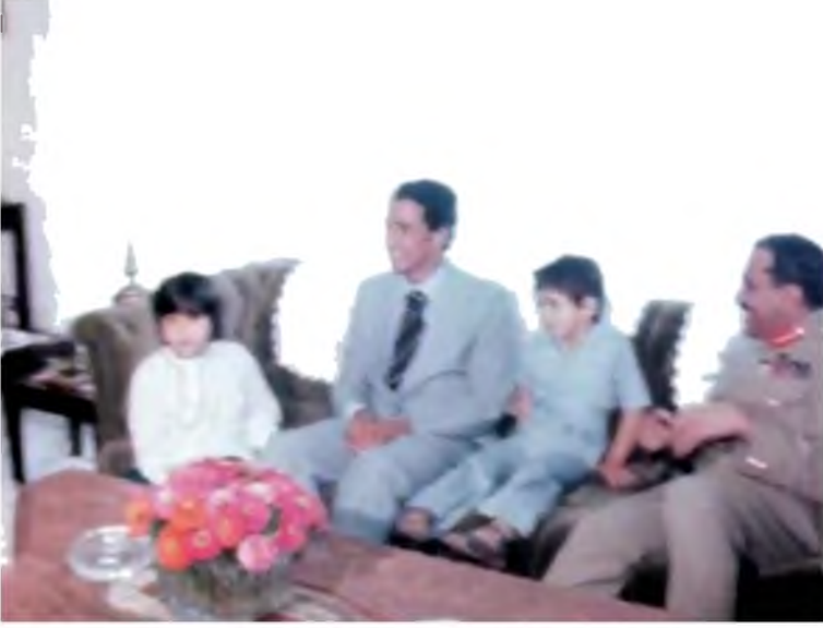
زيارة عبد السلام جلود لباكستان ولقاؤه الجنرال ضياء الحق، 1978.